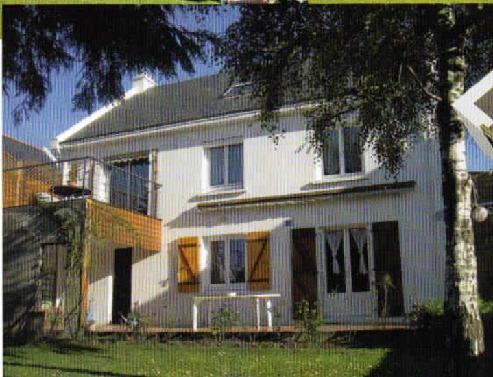
Une maison à Nantes